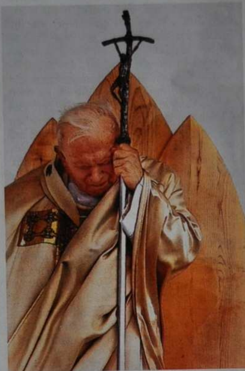
Papst Johannes Paul II. 1999

Doch merkwürdigerweise fühlen wir uns auch innerlich leer dabei, zumindest die Empfindlicheren unter uns. Und haltlos. Und verloren. Gilbert Chesterton, Schöpfer des scharfsinnigen Pater Brown, hat in seiner „Orthodoxie“ beobachtet: „Das